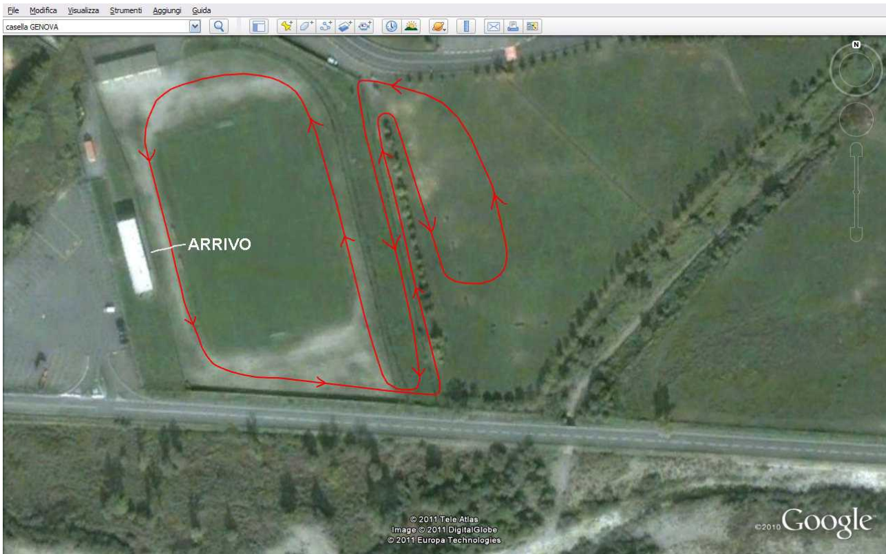
Giro corto 1000 metri