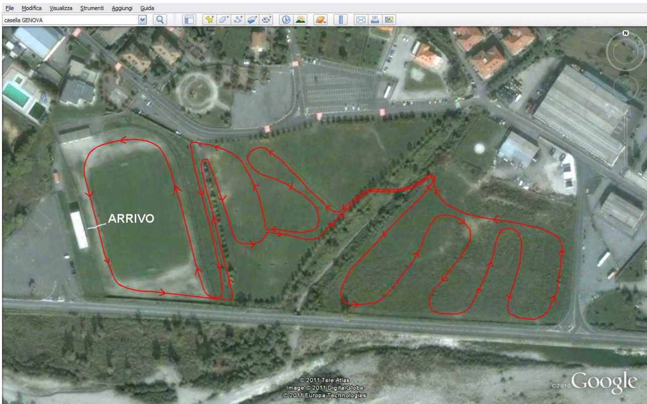
Giro lungo 2500 metri